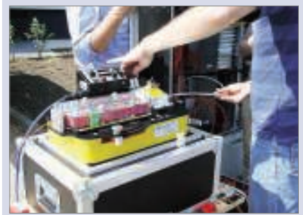
Das Ziel der Landesregierung: Breitbandanschlüsse für alle niedersächsischen Haushalte bis 2020.

Mo. 9.00 – 12.30 Uhr und 14.00 – 16.00 Uhr Di. 9.00 – 12.30 Uhr und 14.00 – 18.00 Uhr, Mi. 9.00 – 12.30 Uhr, Do. 9.00 – 12.30 Uhr und 14.00 – 18.00 Uhr Fr. 9.00 – 12.30 Uhr.