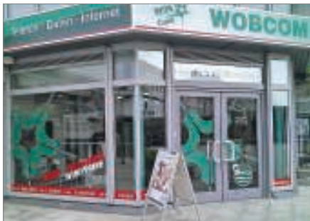
Ob privat oder geschäftlich – immer mehr Kunden entscheiden sich beim schnellen Internet für die WOB COM.

Die WOB COM GmbH hat zum Teil mit Mitteln der EU und vom Land kontinuierlich in den Breitbandausbau bisher mit DSL unterversorgter Ortsteile in der Region Wolfsburg, Helmstedt und Gifhorn investiert. Die Mehrzahl der Projekte wurde bisher in FTTC (fibre to the curb) umgesetzt, so dass bis heute über 130 Kabelverzweiger (KVZ) erschlossen wurden. In den letzten drei Jahren ist der Ausbau mit VDSL-Technik vorrangig in den Gebieten erfolgt, in denen die DSL-Bandbreiten noch unter sechs Mbit/s lagen. Die Anbindung an das Kernnetz erfolgt mit Glasfaserübertragungswegen. In ländlichen Gebieten, wie zum Beispiel in der Samtgemeinde Velpe, wurde aber auch auf lizensierte Richtfunktechnik zurückgegriffen.