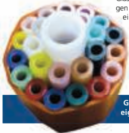
Glasfaser bis in die eigene Wohnung.

Dafür wird ein umfassendes Förderkonzept umgesetzt, mit dessen Hilfe bis 2020 eine Milliarde Euro an Investitionen für das niedersächsische Breitbandnetz zur Verfügung gestellt werden sollen. Über Zuschüsse und Kredite sollen die Landkreise gerade in den dünner besiedelten, ländlichen Gebieten in die Lage versetzt werden, den Ausbau der schnellen Internetverbindung voranzutreiben. Alle Regionen, alle Betriebe und alle Bürgerinnen und Bürger sollen so im Interesse gleichwertiger Lebens- und Arbeitsbedingungen schnelle Internetverbindungen erhalten. Das könnte auch für die WOB COM, die ohnehin schon seit langem erfolgreich um EU- und Landesmittel für den Ausbau des schnellen Internets wirbt, bedeuten, auch die bislang schlechter versorgten Gemeinden in den angrenzenden Landkreisen noch zügiger mit den schnellen Breitbandanschlüssen versehen zu können.